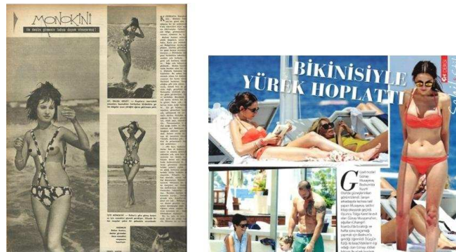
Şekil 3. SES Dergisinde Yer Alan Cinsel İçerikli Fotoğraflar (1964 ve 2014 Yılı)