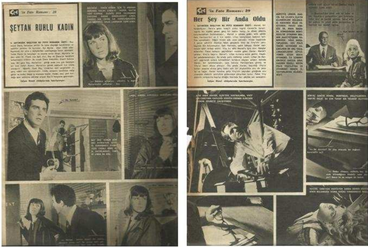
Şekil 2. 1964 Yılında Yayınlanan SES Dergilerinde Yer Alan Fotoromanlar

1964 yılında yayınlanan dergide bulmaca ve poster de sunulmuştur. Okurlara aylık takvimli posterler sunan dergi ayrıca okurlarına yüksek meblağlı hediyeler sunan promosyonlarda yapılmıştır. Bu promosyonlardan en önemlisi Şişli ilçesinde yer alan bir “daire” olmuştur. Dergi kuponlar yayınlamaya okurlarının bu kuponları toplayarak Şişlide yer alan bir daire kazanma şansı sunmuştur. “Apartman Dairesi Kupon ve Kurası” adıyla hazırlanan promosyon çalışmasının sonunda bir dergi okuru daire kazanmıştır. Promosyon yayın grubunun diğer dergisi Hayat Dergisi ile ortaklaşa yapılmış, promosyonun finansal destekleyicisi ise Yapı Kredi Bankası olmuştur. Ses Dergisi “Hayat Dergisinin tertiplemediği ikramiyeye Ses Okuyucuları da aynı şartlarla katılabileceklerdir” duyurusu ile iki derginin okurunu tek promosyonda birleştirmiştir. Bu dergi sahibinin yatay yönde büyüme gösterirken iki mecrayı ortak bir tanıtım paydasında kullandığını göstermektedir.