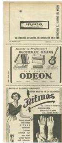
Şekil 1. 1964 ve 2014 Yıllarında Yayınlanan SES Dergilerinde Yer Alan Reklamlar

Ses Dergisinin 1964 yılında yayınlanan sayılarında yayınlanan reklamlar daha azken 2014 yılında yayınlanan reklamlar daha fazla sayıda olmuştur. Derginin 1964 yılında yayınlanan reklamları daha çok bilgi vermeye yönelik tasarlanırken, 2014 yılında yayınlanan reklamlarda daha fazla görsel içerik kullanılmıştır. Dergi reklamcılığının elli yılda geçirdiği sözelden görsele olan değişim bu iki derginin reklamlarında da göze çarpmaktadır. 1964 yılında yayınlanan reklamlarda dikkat çeken bir diğer özellik ise çok az sayıda tam sayfa reklamın olmasıdır. 2014 yılında yayınlanan reklamların tamamı en az bir tam sayfa olmuş, bazı reklamlar ise iki tam sayfaya kadar çıkmıştır.