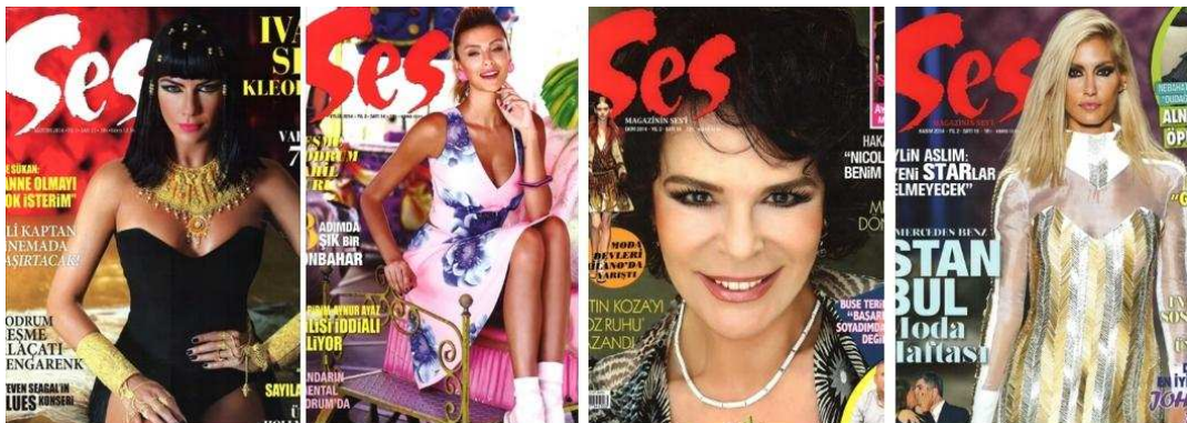
Şekil 5. 1974 ve 2014 Yıllarında Yayınlanan Ses Dergilerinin Kapakları