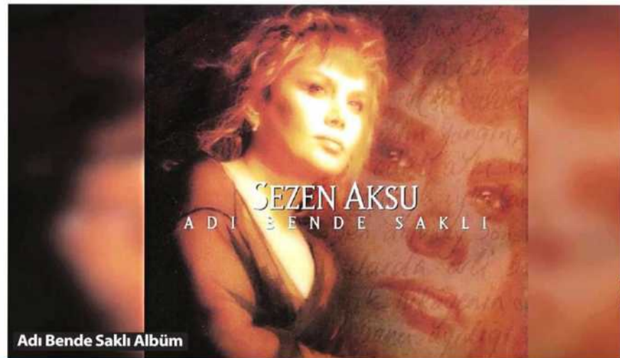
Adı Bende Saklı Albüm

onu dokuz köyden kovmak yerine onu takdir etmeleri lazım. Beni boşverin ama böyle olanlara bunu yapın, yapın ki hep beraber el ele yükselelim, el ele kazanalım, el ele paylaşalım. Gazetecilik mesleği de "goy goy"culuktan çıksın, yetmişli yıllarda olduğu gibi kamuya hizmet etsin.