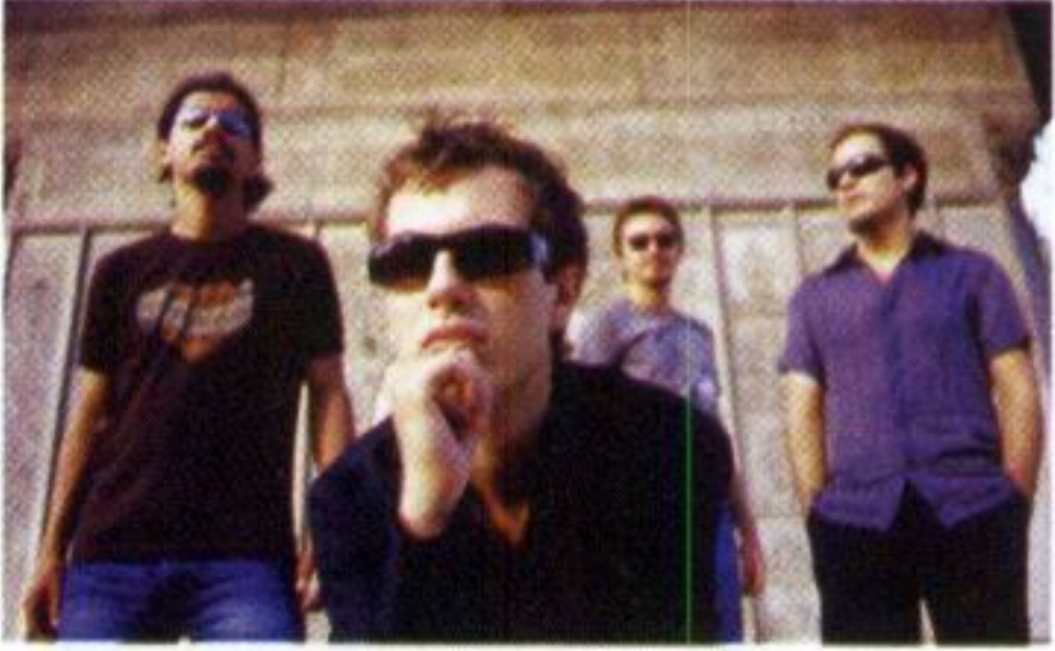
MOR VE ÖTESİ