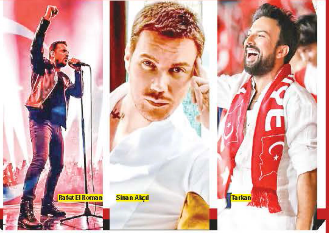
Rafet El Roman